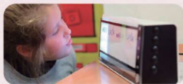
故意に大きく重く作られており容易に移動させられません。 子どもたちは順番と時間の経過を可視化することで、見通しを持つことができます。