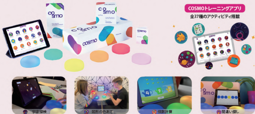
COSMOトレーニングアプリ 全37種のアクティビティ搭載

認知能力、身体能力、コミュニケーション能力を発達させて意欲を高めるアクティビティシステム COSMOは共同注意、順番、運動、順序交代、実行機能など発達をサポートするインクルーシブ教育のための非常に優れた学習システムです。