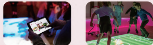
5,000以上の画像や音声素材を含む豊富なメディアライブラリー内蔵